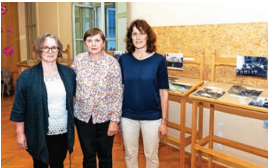
Razstavo so pripravile Marija Demšar, Marija Rovtar in Julijana Prevc.