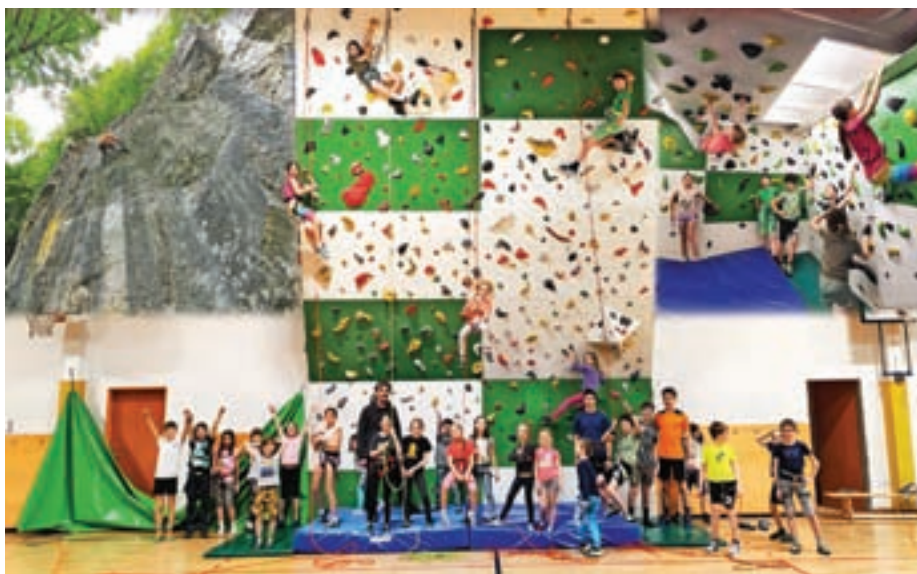
Po izgubi naravnega plezališča pod Sušo bodo povečali plezalne površine v telovadnici OŠ Železniki.