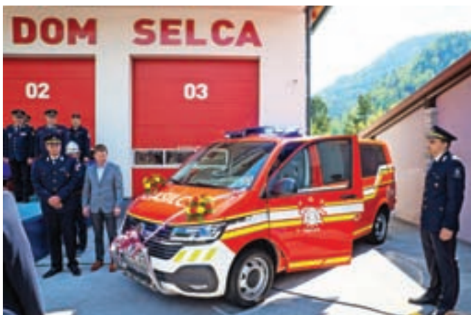
Velika pridobitev je tudi kombi za prevoz moštva GVM-1.

Prvi gasilski dom v Selcih je bil zgrajen leta 1910, odprtje novejšega pa so dočakali leta 1985, a sta prostorska stiska in stalna vlaga vodili v želje po novejšem gasilskem domu. Leta 2012 je upravni odbor PGD Selca sprejel sklep, da se ustanovi komisija za izgradnjo novega gasilskega doma. Že naslednje leto je PGD z lastnimi sredstvi kupil zemljišče. Gradbeno dovoljenje za nov dom je bilo izdano leta 2017 in še isto leto so postavili dom, zgrajen iz križno lepljenega lesa. Najprej so uredili pritličje in medetažo in se tako aprila 2019 preselili v nov dom. Nato so se lotili še izdelave prvega nadstropja in podstrešja ter fasade in dvorišča. Zadnja dela so končali lani, 30. aprila letos pa so pridobili tudi uporabno dovoljenje.