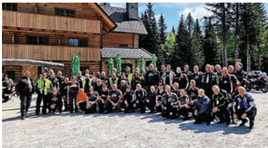
Zadnjo nedeljo v maju so se motoristi Selške doline zbrali na Soriški planini.

V nedeljo, 28. maja, so se na Soriški planini ponovno zbrali motoristi Selške doline. Na zbor je prišlo lepo število motoristov in vreme jih je nagradilo z vročim soncem. Na zbor so si razdelili majice, za katere se lepo zahvaljujejo vsem sponzorjem, ki so jim pomagali pri nakupu. Srečanje motoristov pomeni tudi srečanje vseh generacij, kar je še posebno lepo in pristno. Kar veliko motoristov je v Selški dolini, v FB-skupini jih je zabeleženih 160, verjetno pa je še kakšen, ki se še ni javil. Ta konec tedna se selški motoristi odpravljajo na tridnevno turo v Bratislavo. Javni zavod Ratitovec