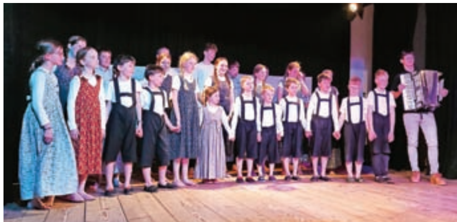
S kulturne prireditve v Sorici